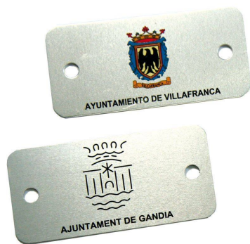
Plaqueta aluminio 74 x 35 mm.