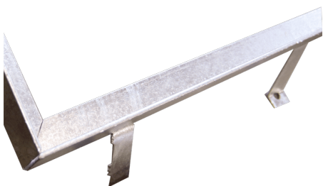
Marc angular de acero, L45°