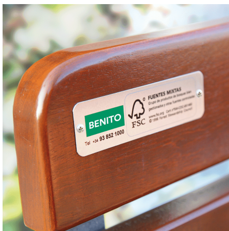
Madera con certificado FSC o PEFC.