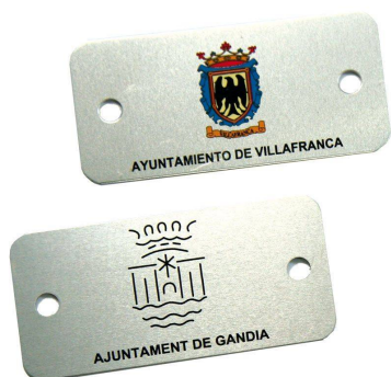
Plaqueta aluminio 74 x 35 mm.