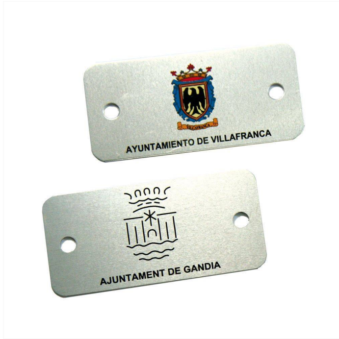
Plaqueta aluminio 74 x 35 mm.