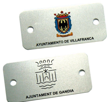
Plaqueta aluminio 74 x 35 mm.