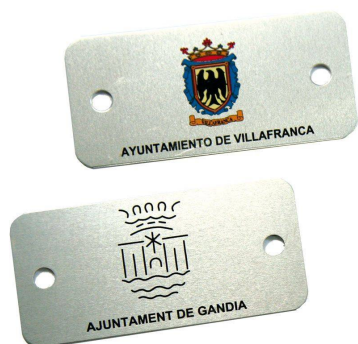
Plaqueta aluminio 74 x 35 mm.