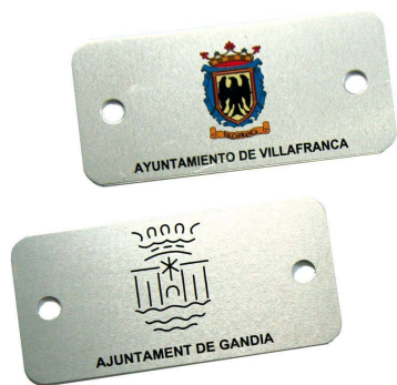
Plaqueta aluminio 74 x 35 mm.